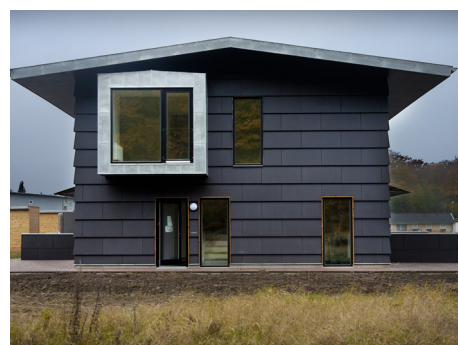
Skibhus Skovkrat, Odense